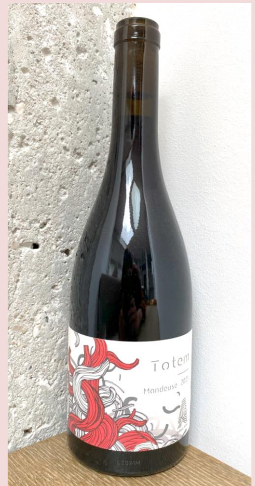
Evolution de la Mondeuse Totem sur 2019, 2020 et 2021